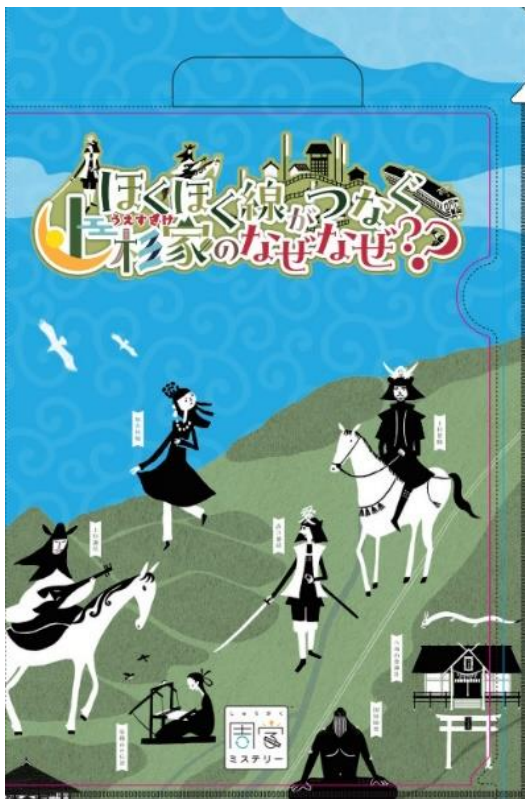
クリアファイルバッグ