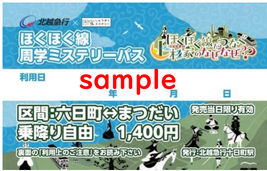
ほくほく線 周学ミステリーパス