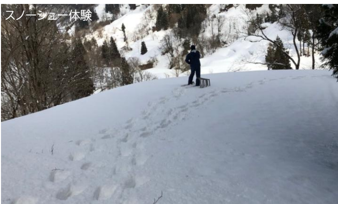
スノーシュー体験