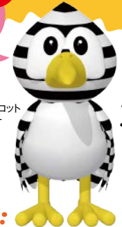
小谷村マスコット キャラクター たりたり OTARI