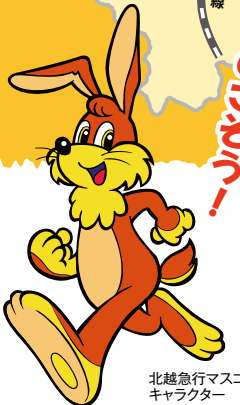
北越急行マスコット キャラクター ホックン