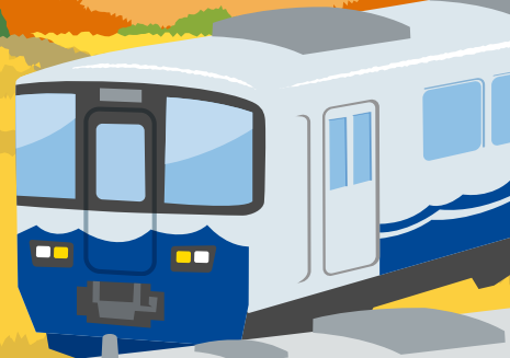
日本海ひすいライン ET122系