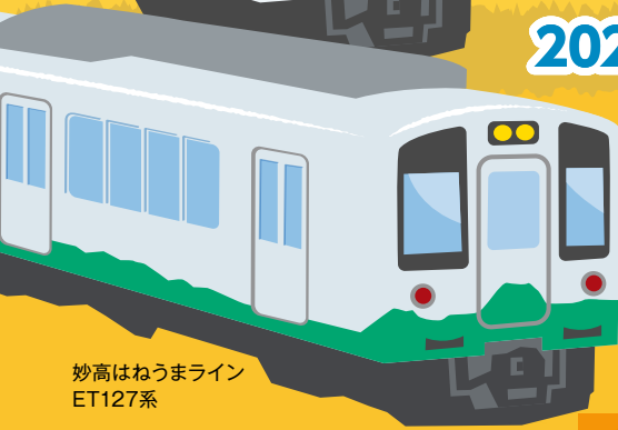
妙高はねうまライン ET127系