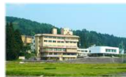
六日町温泉 政府登録国民관광施設/日本観光協会

※六日町温泉ほてる木の芽坂(夕食有、朝食無)のご宿泊プラン チェックアウトは11:00です。