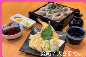
繁蔵 / 天ざるそば