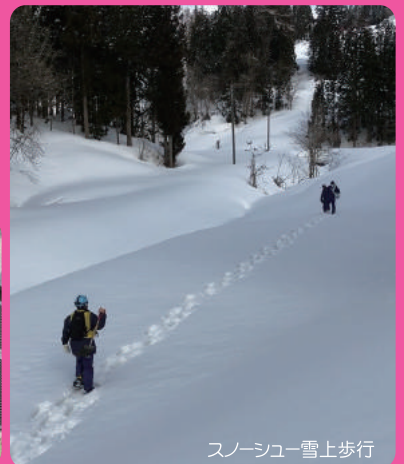
スノーシュー雪上歩行