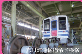
六日町運輸指令区検修