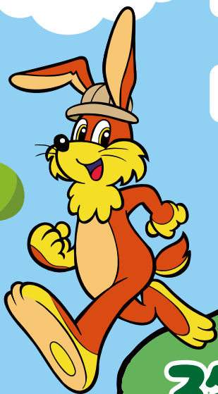
北越急行マスコットキャラクター ホックン