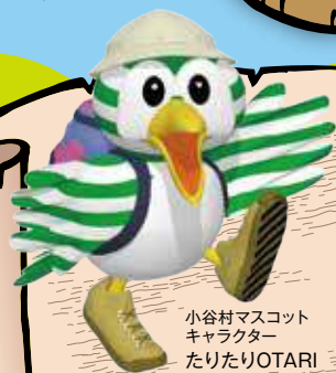
小谷村マスコットキャラクター たりたりOTARI