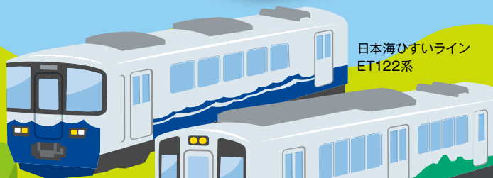
日本海ひすいライン ET122系